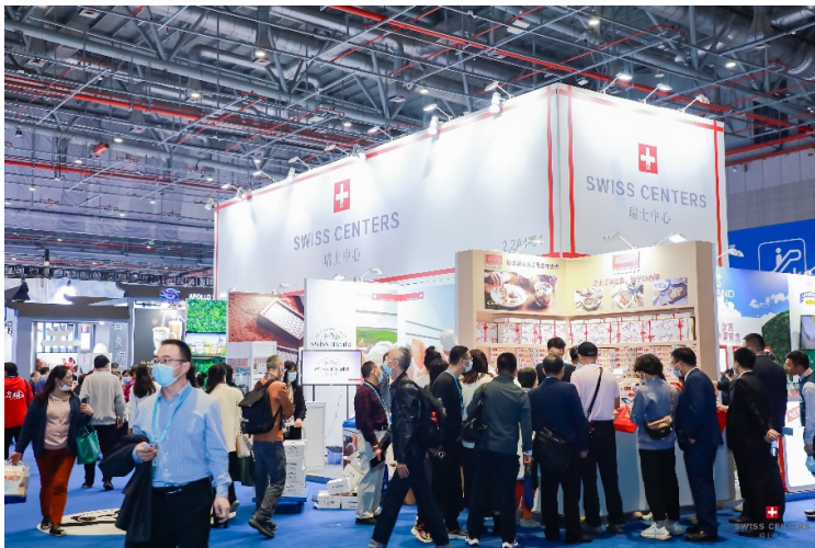
Bildunterschrift: Der Swiss Centers Stand an der CIIE 2021.