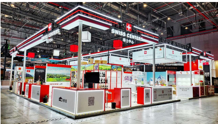
Bildlegende: Der Swiss Centers Gemeinschaftsstand 2024.