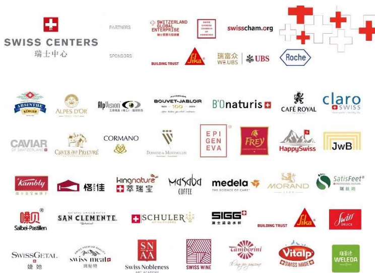
Bildlegende: Am Gemeinschaftsstand des Swiss Centers auf der CIIE werden verschiedenste Schweizer Marken vertreten sein.