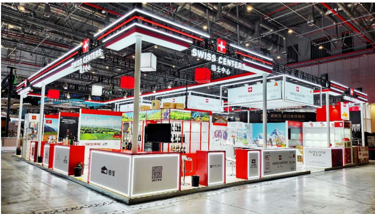
Légende : le stand 2024 du cluster mise sur pied par Swiss Centers.