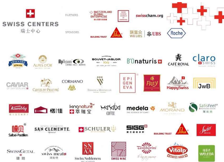
Légende : le stand du cluster suisse à la CIIE accueille une grande variété de marques suisses.