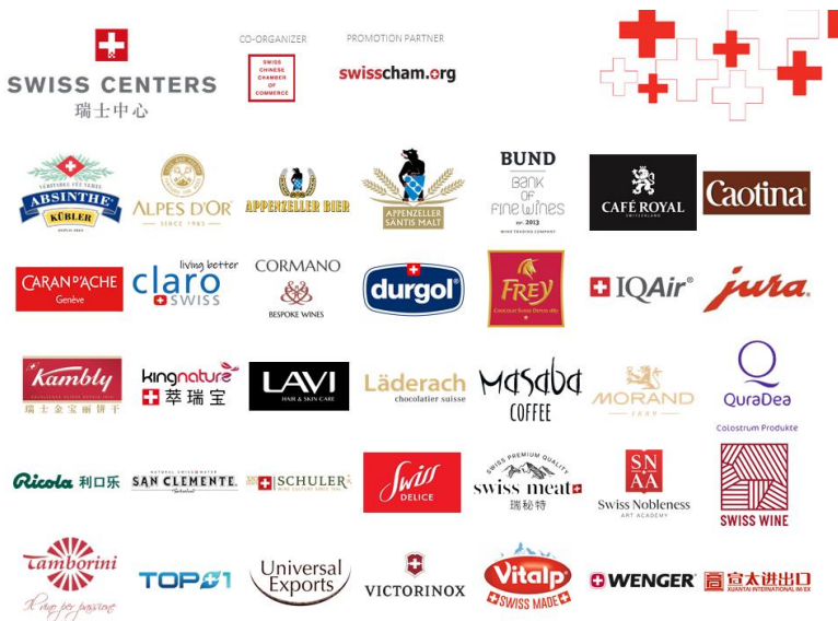
Légende : plus de 25 marques suisses présentent leurs produits de haute qualité à la CIIE 2021.