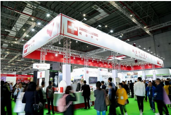
Légende : un avant-goût de la Suisse en Chine – Swiss Centers met sur pied un stand suisse lors de la China International Import Exhibition 2021. Sur la photo, le stand de 2019.

La CIIE, le premier salon mondial dédié à l'importation, « continuera d'être une manifestation géante pour les derniers produits, technologies et services », ont déclaré les organisateurs lors d'une récente conférence de presse. Comme les années précédentes, l'objectif du salon en 2021 est d'aider les entreprises et les acheteurs participants à conclure des affaires et de futurs accords de coopération.